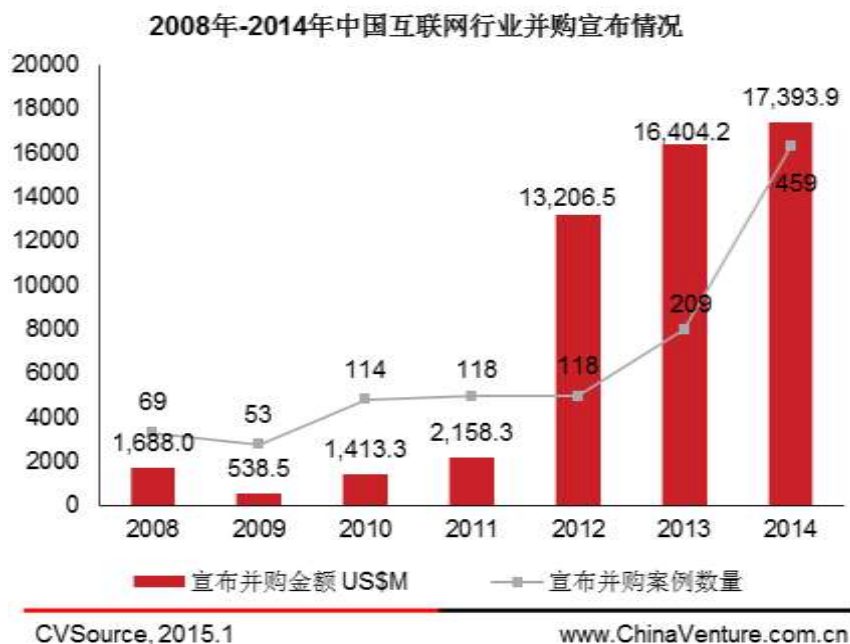
图 4 2012Q1-2014Q3 中国互联网行业并购宣布情况

在今年互联网行业并购宣布中，网络游戏并购成热点，全年网络游戏宣布并购案例 76 例，并购宣布金额 71.6 亿美元，占全年互联网并购宣布金额 41.16%（见图 5）。其中，盛大游戏收到其控股股东牵头的财团的 19 亿美元的私有化要约，为本年度互联网并购宣布案例金额最高大的一例。