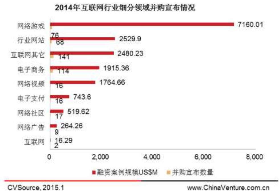
图 5 2014 年互联网行业细分领域并购宣布情况