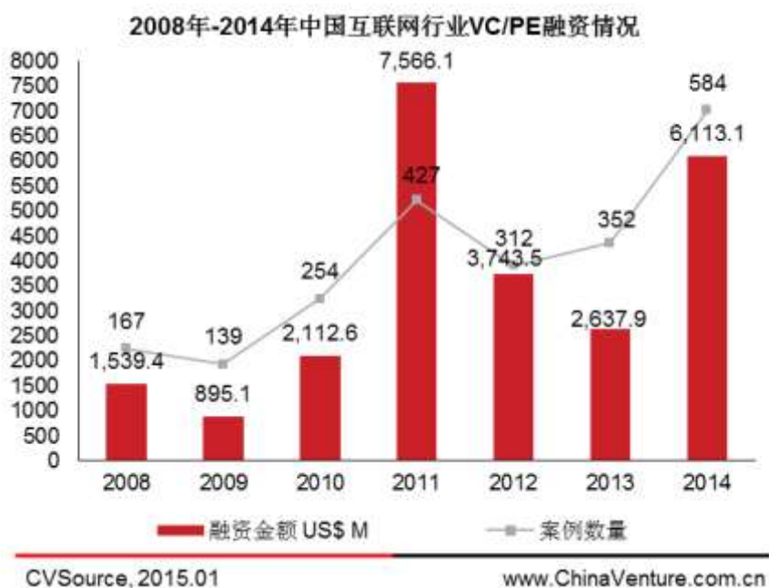
图 1 2008 年-2014 年中国互联网行业 VC/PE 融资情况

2014 年互联网行业 VC/PE 融资继续增长。根据 CVSource 投中数据终端显示，2014 年互联网行业 VC/PE 融资案例 584 例，同比增长 65.91%；披露金额 61.13 亿美元，同比大增 131.74%（见图 1）