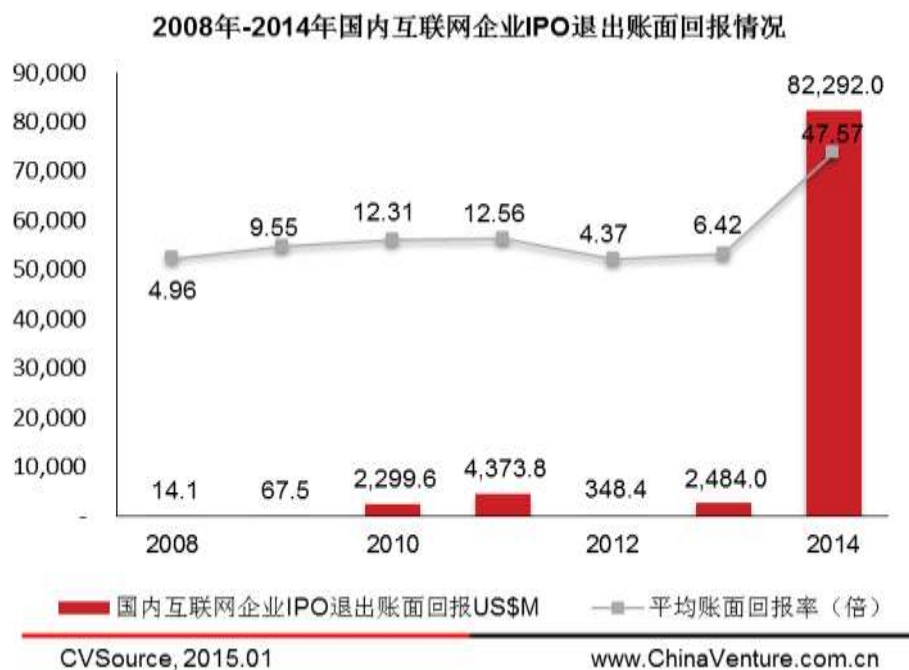
图6 2008年-2014年国内互联网企业IPO退出账面回报

本年度，VC/PE 机构参与互联网企业 IPO 获得退出的 35 笔。软银在阿里巴巴集团上市获得 542.47 亿美元账面退出（根据阿里巴巴集团上市发行价计算），根据公开信息获知，软银于 2000 年注资阿里巴巴集团 2000 万美元、2005 年 8 月注资 1.8 亿美元（雅虎并购阿里巴巴交易中一部分）共计 2 亿美元。据此计算，软银的退出回报率 271.23 倍。另外，软银曾在 2004 年注资淘宝网 6000 万美元，2005 年随着雅虎并购阿里巴巴交易获得 3.6 亿美元退出，退出回报率 6 倍。