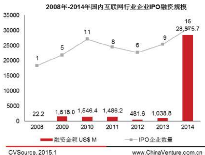
图3 2008年-2014年国内互联网行业企业IPO融资规模

阿里巴巴集团今年 Q3 于纽交所上市，募集金额 250.32 亿美元，创全美最大 IPO；占据全年中企 IPO 规模总额的 35.77%，并超过 2008 年以来其他国内互联网企业 IPO 总和（见图 3、表 2）。京东于今年 Q2 于纳斯达克上市，募集 17.8 亿美元，其规模也超过 2013 年全年国内互联网企业 IPO 规模（见图 3、表 2）。