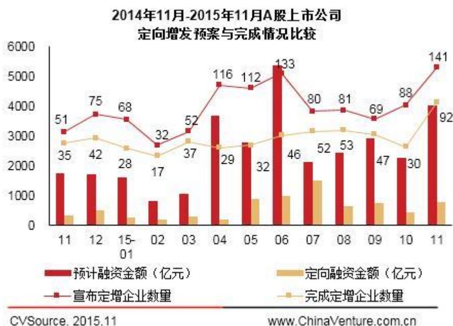
图1 2015年11月至2015年11月A股上市公司定向增发预案与完成情况比较

根据投中研究院统计数据显示，本月共有92家A股上市公司实施了定向增发方案，数量与上月30家相比上升了206.67%；再融资金额为775.07亿元，环比上升了77.08%。与此同时，本月有141家A股上市公司宣布了定向增发预案，环比上升了74.07%；预计融资金额总计4037.78亿元，环比上升77.74%。从单笔融资金额来看，本月实施定增的92家企业平均单笔融资金额为8.42亿元（见图1）。